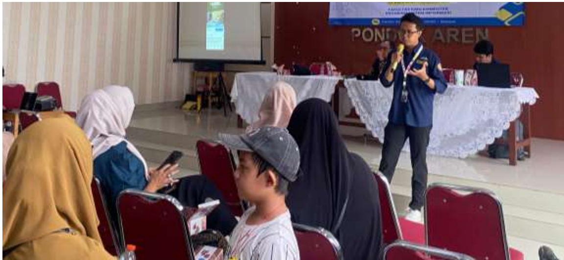
Gambar 2. Pelatihan dasar dan Workshop Meta Ads

Workshop Optimalisasi Konten Iklan Menggunakan AI Pada tahap selanjutnya, kegiatan diarahkan pada workshop praktis tentang pemanfaatan Kecerdasan Buatan (AI) untuk menciptakan dan mengoptimalkan konten iklan yang menarik dan efektif. Materi yang disampaikan meliputi pengenalan berbagai tools AI yang relevan, teknik prompt engineering sederhana untuk menghasilkan teks iklan yang persuasif, serta cara memanfaatkan AI untuk ide visual dan desain iklan dasar. Hasil dari workshop ini sangat positif; beberapa peserta berhasil menciptakan draf konten iklan yang inovatif dan relevan dengan produk UMKM mereka. Kemampuan AI dalam mempercepat proses kreasi konten dan meningkatkan kualitas estetika visual sangat diapresiasi oleh para peserta, yang sebelumnya kesulitan dalam aspek ini.