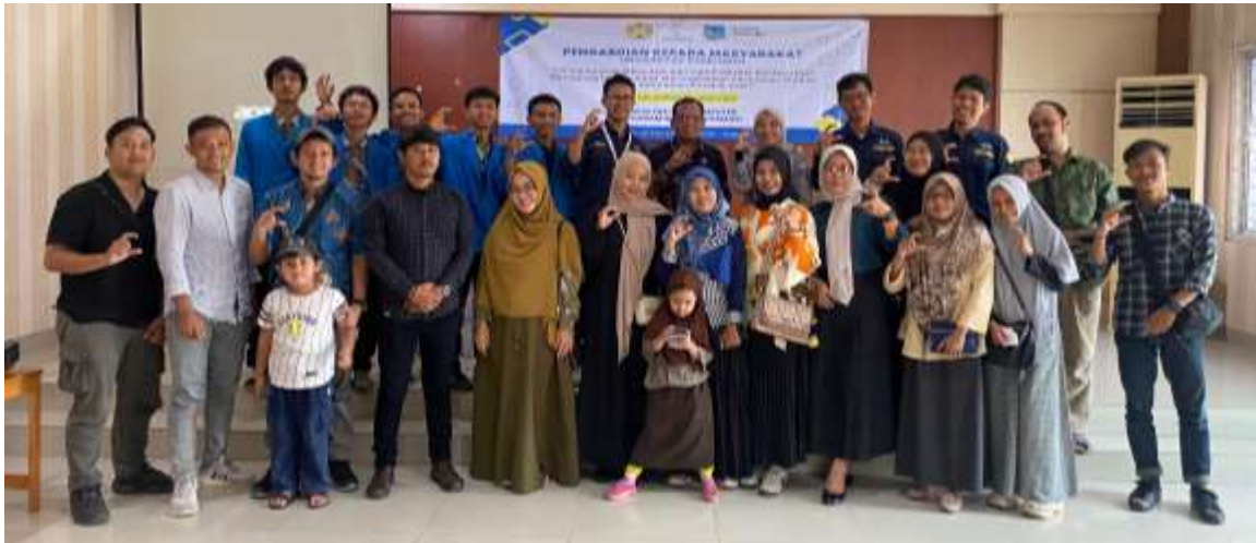
Gambar 3. Peserta UMKM Kelurahan Pondok Aren

yang berbeda-beda digunakan untuk memberikan gambaran nyata dan solusi yang spesifik. Meskipun masih dalam tahap awal implementasi, beberapa UMKM mulai menunjukkan peningkatan interaksi pada postingan iklan mereka dan adanya peningkatan jangkauan yang lebih luas dibandingkan sebelumnya, berkat penargetan audiens yang lebih spesifik menggunakan fitur Meta Ads.